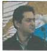
جافار پناهی مستند