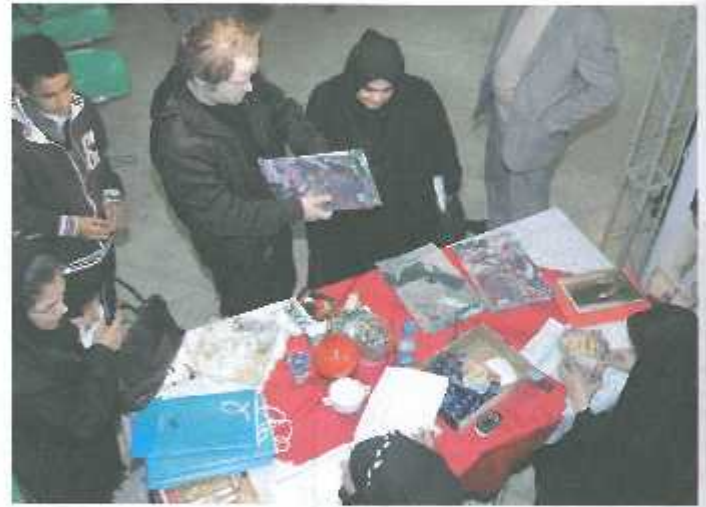
گزارش از چهارمین روز جشنواره سینما حقیقت؛