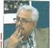
اردیبد | عضو هیأت انتخاب مستندهای پرتره

در عرصه سینمای مستند در بخش پرتره اتفاق جدیدی در حال روی دادن است و آثار از انگوهای قدیمی دور می‌شوند. در این دوره از جشنواره بین‌المللی سینما حقیقت در بخش پرتره مستندهای گوناگون با سطح کیفیت‌های مختلفی از سان شده بود برخی از آثار با ساختار تلویزیونی به شکل کلاسیک به موضوع پرداخته‌اند. در بسیاری از موارد به علت سابقه سفارش دهندگان آثار شبیه هم شده بودند. اما برخی دیگر از مستندسازان از زوال عادی را رافرا تر گذاشته و با روشی نو فیلم ساخته بودند.