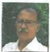
مستندساز فیلم سردبیر

کمی دور از دفاع مقدس را مرور کنیم و اکنون کشورمان و نیز بسیاری از ممالک بحران زده را با آن بام به مقایسه بکشانیم. چه کسی و چگونه و با خلق چه زیبایی‌هایی امروز ما را به ارمغان آوردند؟ جنگ و صلح مقوله‌هایی مورد توجه و اهتمام مستندسازان است. واقعیت‌هایی که همواره از نظر کمی و کیفی، دستمایه مستندهای بسیاری قرار گرفته و همچنان آثاری در این زمینه ساخته و پرداخته می‌شود.