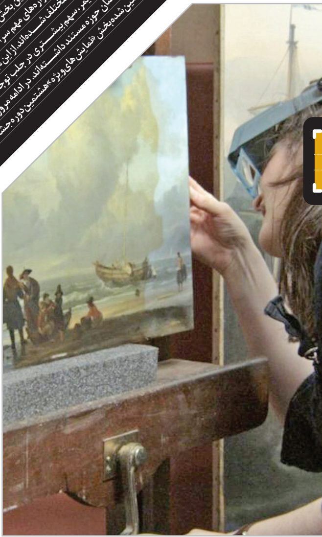
پنجشنبه ۱۳ آذرماه ۱۴ دسامبر ۲۰۱۴ فلسطین ۱

تیم رابی، منتقد سینمایی «تلگراف»، در پی نمایش «گالری ملی» در جشنواره فیلم کن، آن را اثری عمیقاً الهام‌بخش توصیف کرد. رابی در این باره می‌نویسد: «لذت واقعی فیلم او آوازیمن است که برای اثر بخش بودن به هیچ وجه نیازی به زور زدن ندارد؛ تنها نظاره‌گر است. گویی به اتکای هوشمندی آگاهانه سازنده‌اش، وقار یافته است.» ریچارد برودی، منتقد «نیویورک» عقیده دارد که «مستند تحلیلی درخشان وایزمن به بازنمایی زنده تصاویر و صداها می‌پردازد؛ همان چیزی که ژان لوک گدار در تازه‌ترین فیلمش «خداحافظی با زبان» با آن وداع گفته است.» الیور لیتلن در «بندی وایر» ضمن توصیف «گالری ملی» به عنوان «غذای سینمایی ذهن» می‌نویسد: «این فیلم بیش از هر چیز، درباره هنر است، درباره قدرت، طبیعت چندگانه‌اش و میراثی که می‌تواند خلق کند و بر همین اساس، «گالری ملی» فیلمی است درباره زمان و تأثیری که می‌توان بر جهان باقی گذارد.»