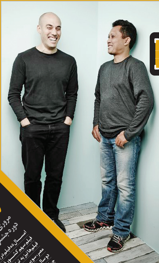
دوشنبه ۱۰ آذرماه ۱۵ دسامبر ۲۰۱۴ فلسطین ۱